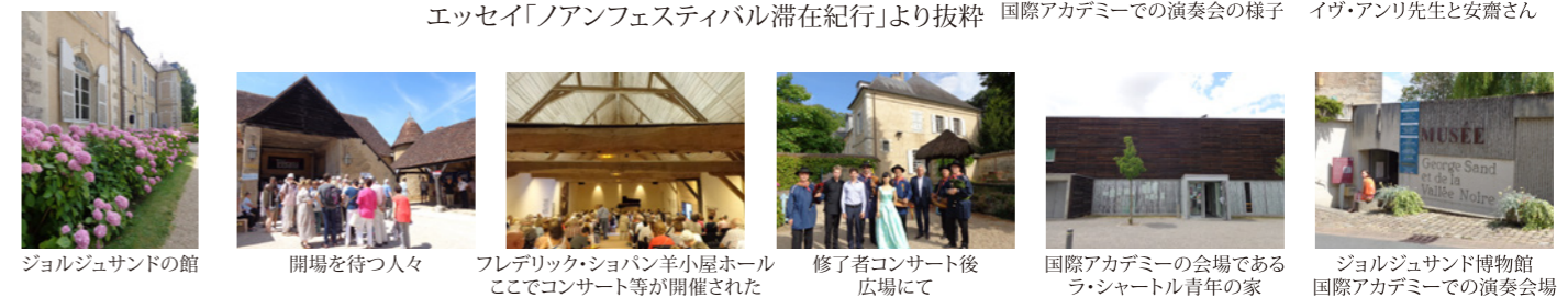
ジョルジュサンドの館 開場を待つ人々 フレデリック・ショパン羊小屋ホールここでコンサート等が開催された 修了者コンサート後広場にて 国際アカデミーの会場であるラ・シャートル青年の家 ジョルジュサンド博物館 国際アカデミーでの演奏会場