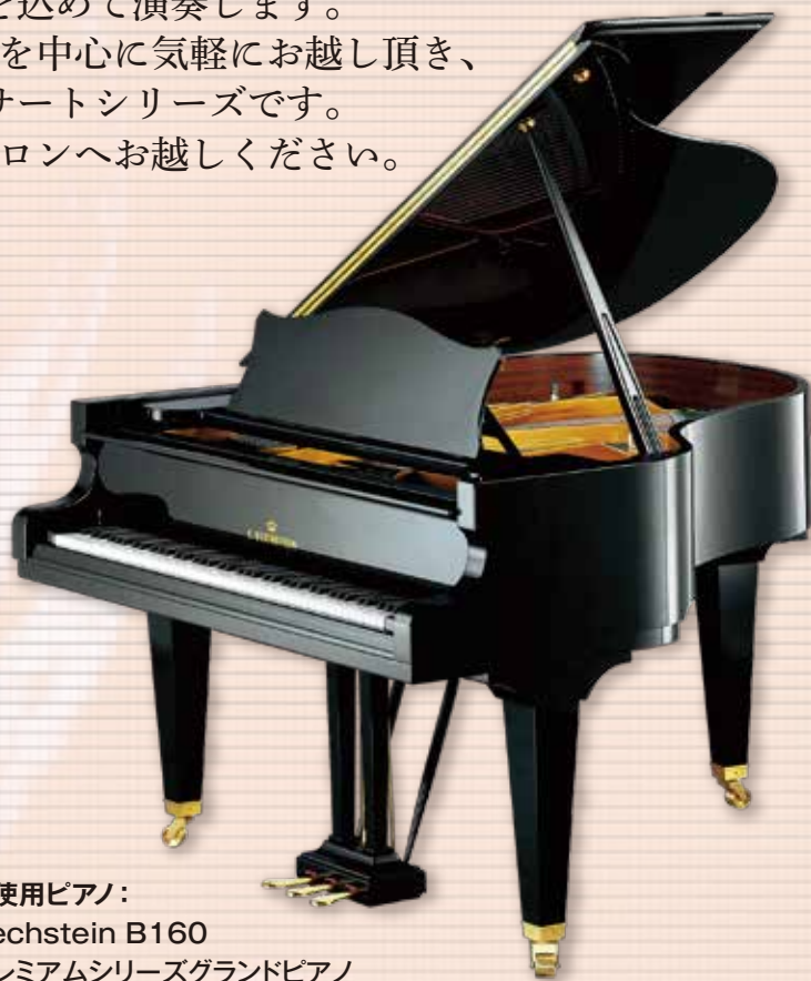
当日使用ピアノ： Bechstein B160 プレミアムシリーズグランドピアノ

武蔵野音楽大学附属高等学校卒業。第20回長江杯国際音楽コンクールピアノ部門大学の部第2位受賞。2014年同校在學生と新卒業生によるコンサートならびに同校卒業演奏会出演。2016年、武蔵野音楽大学ニュー・ストリーム・コンサート出演。土屋和江、土屋実記朗、塚田雄二、福井直昭、ケマル・ゲキチの各氏に師事。武蔵野音楽大学音楽学部ヴィルトゥオーソ学科4年次在学中。