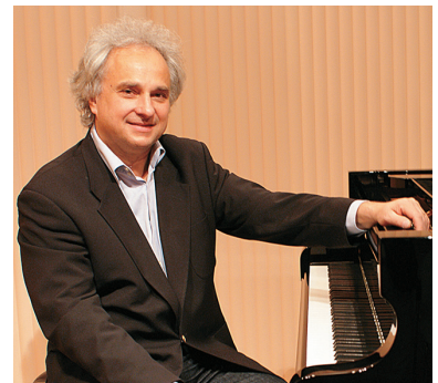
イヴ・アンリ氏プロフィール (ピアニスト・作曲家)

故サンカン、故チッコリーニに師事。 1981年シューマン国際コンクール第1位。 2011年ノアン音楽祭会長就任、2015年ショパン国際ピアノコンクール事前審査員、2016年〜ノアンコンクール審査員長、2016年シューマン国際音楽コンクール審査員、2023年第2回ショパン国際ピリオド楽器コンクール審査員を務める。 ショパンの時代と現代のピアノを使用し、ショパンの生涯、そして音楽言語の深い研究、加えて1840年代の奏法を掘り下げた演奏は、世界中で注目を浴びる。 現在パリ国立高等音楽院、パリ地方音楽院にて教鞭をとる一方、演奏者、作曲家としても活躍する。